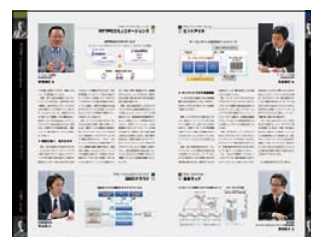
IIJ様、日本ラッド様、GMOクラウド様 ビットアイル様、NTTPCコミュニケーションズ様 NTTコミュニケーションズ様