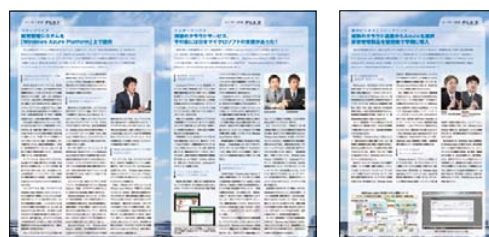
日本マイクロソフト様